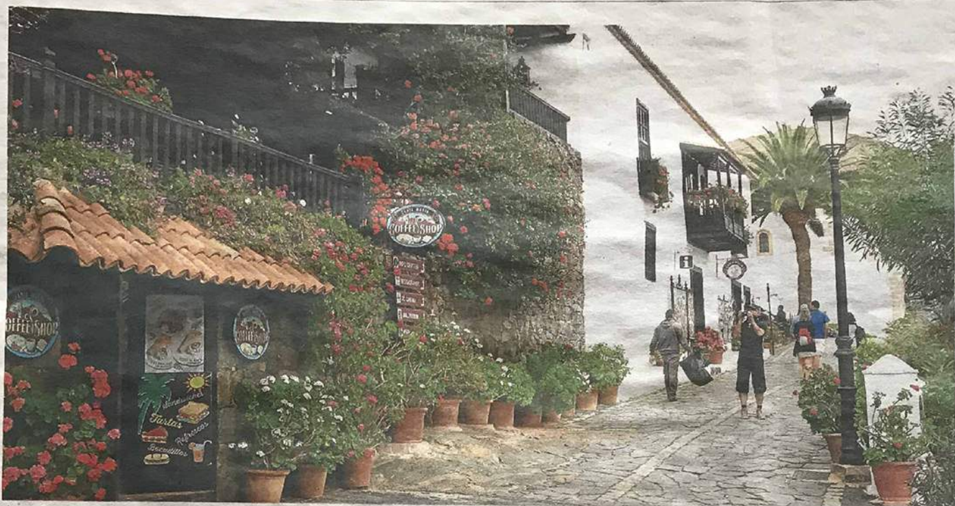
Casa Santa María, en Betancuria casco, es el proyecto más antiguo de Reiner Loos.